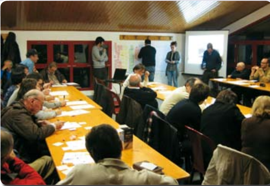
Workshop INU a Panico.

Il gruppo, formato da quattro architetti di Bologna, ha già avviato il lavoro di analisi e confronto con il consiglio di frazione e con il Parroco. Importante, sottolineare, che il lavoro svolto sarà presentato alla biennale di Roma che l'INU sta organizzando per il 2011 ( www.ciclostilearchitettura.me ).