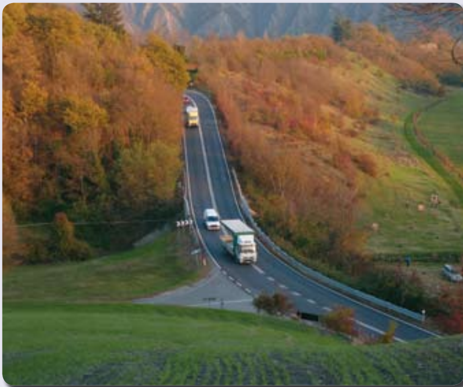
La Porrettana fra Marzabotto e Pian di Venola

Un'importante variazione alle normative tecniche di attuazione elimina la possibilità, da parte dei soggetti attuatori, di permutare l'obbligo di realizzazione di parcheggi con una semplice compensazione economica. Il regolamento d'igiene è stato modificato adeguandolo a parametri che negli ultimi anni si sono modificati sia per l'entrata in vigore di molteplici nuove norme, sia per l'introduzione di attività un tempo non esistenti. Tale variazione ha permesso, fra l'altro, di risolvere con soddisfazione di tutte le parti in causa, l'annoso contenzioso relativo all'allevamento di suini allo stato brado in località Luminasio.