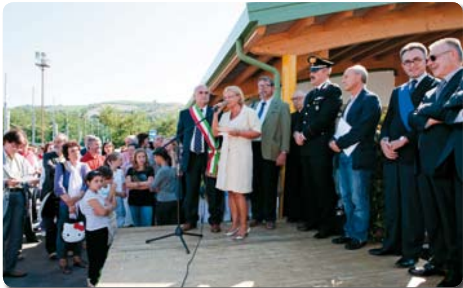
Inaugurazione della nuova scuola elementare.

G rande fermento urbanistico nel Comune di Marzabotto, che ha regalato nuovi edifici pubblici alla comunità. È nata una nuova scuola elementare, molto grande e dotata di spazi in grado di accogliere diverse attività, ed è nato anche il nuovo Centro Musicale.