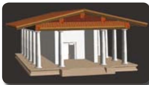
Immagine 3D del tempio urbano di Marzabotto.

Si è appena conclusa la campagna di scavo dell'Università di Bologna nella città etrusca di Marzabotto. Le nuove scoperte saranno presto visibili al pubblico