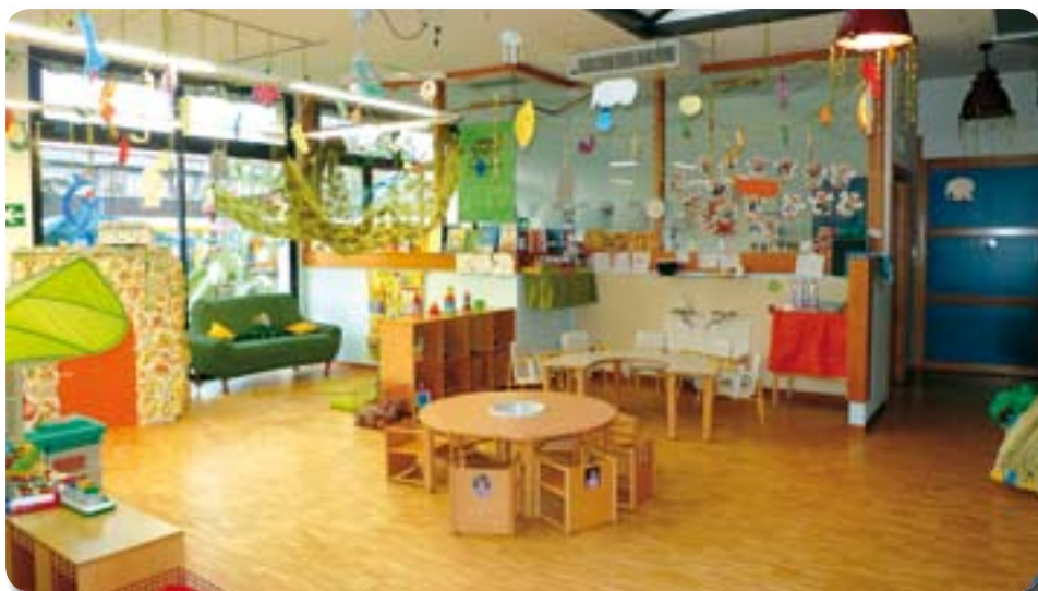
Interno dell'asilo nido di Marzabotto.

Al momento le classi totali coinvolte nei progetti sono 49 con una previsione di circa 200 ore di lezioni/incontri.