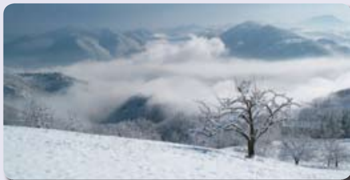
Panorama invernale da Luminasio in una foto di Maren Von Appen.

L'esperienza maturata nella gestione del gruppo di acquisto per l'installazione di pannelli fotovoltaici, ha indotto a ripetere lo stesso percorso per incentivare ed agevolare lo smaltimento delle lastre di amianto disseminate su tutto il territorio. Si è conclusa la fase di individuazione dei luoghi interessati dalla presenza di amianto e sono in corso le trattative con i competenti organi sanitari per le autorizzazioni allo smaltimento e successivamente all'individuazione di una o più ditte specializzate che potranno, intervenendo su larga scala, ridurre sensibilmente i costi dello smaltimento a favore dei singoli cittadini.