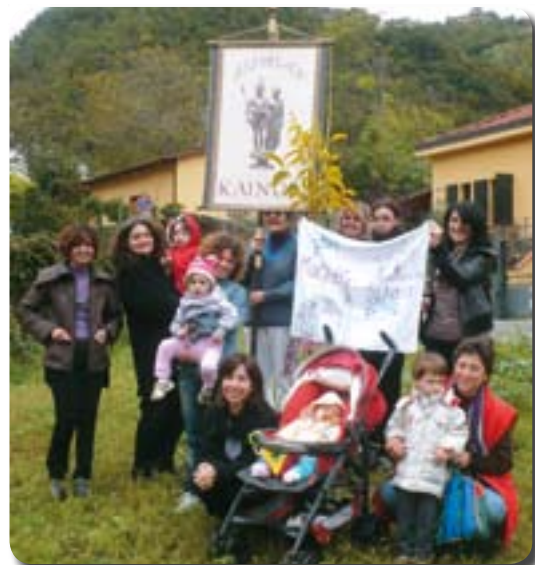
L'albero delle donne.

Non si tratta di un albero qualunque ma di un noce ("Juglans regia"), un albero vigoroso e caratterizzato da un tronco solido, alto, con un comportamento maestoso e radici robuste, un albero in grado di dare buonissimi frutti a disposizione di tutti i sibanesi.