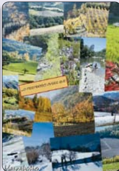
Campagna di sensibilizzazione al cittadino realizzata da Maren Von Appen